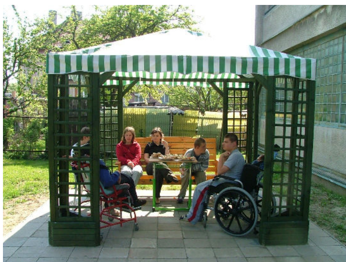
Zahradní altáněk byl v roce 2006 zbudován za finanční pomoci Nadace Děti-kultura-sport

Krátkodobý finanční majetek k 31.12.2006 má hodnotu 496 878,43 Kč.