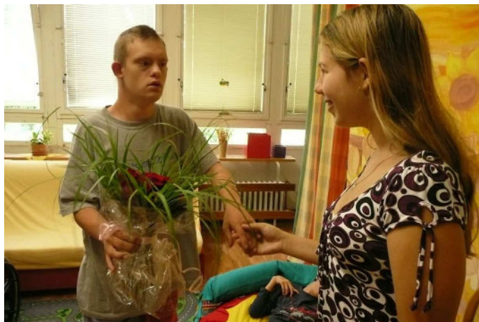
Oslava narozenin mé kamarádky ze stacionáře

Ve stacionáři mě těší poslouchat muziku, velmi rád a dobře zpívám a rytmizuji. Velmi rád se proto účastním hodin muzikoterapie i canisterapie, které u nás ve stacionáři pravidelně probíhají. Jsem rovněž dobrý tanečník. Nevadí mně ani další pohybové hry či drobné rukodělné práce. S oblibou sleduji filmy či písňové videoklipy, rád chodím na procházky. Baví mě rovněž návštěva kulturních akcí, anebo když se nějaká z nich koná u nás ve stacionáři. Když sami pak zkusíme divadlo, jsem jeden z nejpilnějších a nejaktivnějších herců. Když chci být sám, rád strávím chvílku ve speciální relaxační místnosti s vodní postelí, které u nás ve stacionáři říkáme Kouzelník. A co nemám na rozdíl od mnoha jiných lidí rád? Věřte nevěřte, je to řízek!