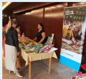
Město lidem Uh. Brod