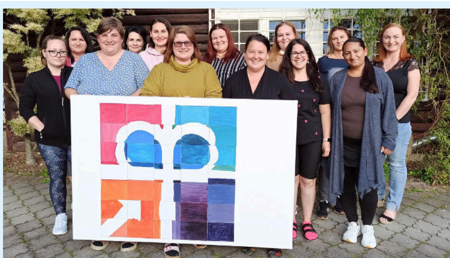
Teambuilding všech pracovníků střediska

FORTELNOST znamená důkladnou a odborně provedenou práci.