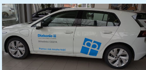
Nový automobil pro terénní služby